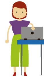
Máy tính xách tay