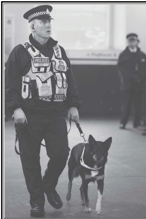
Bruno Vincent / Staff

fácilmente. Su presencia y sus gruñidos asustan a los criminales. Esto ayuda a que la policía los atrape. Los perros policía son rápidos y fuertes. Además, tienen muy desarrollado el sentido del olfato. Algunos perros policía están entrenados especialmente para localizar objetos peligrosos.